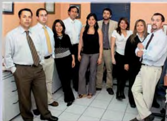
EQUIPO DE TRABAJO JEFATURA NACIONAL DE ASUNTOS PÚBLICOS

Diseño: Malva Verdugo G. Impresión: B & B Impresores.